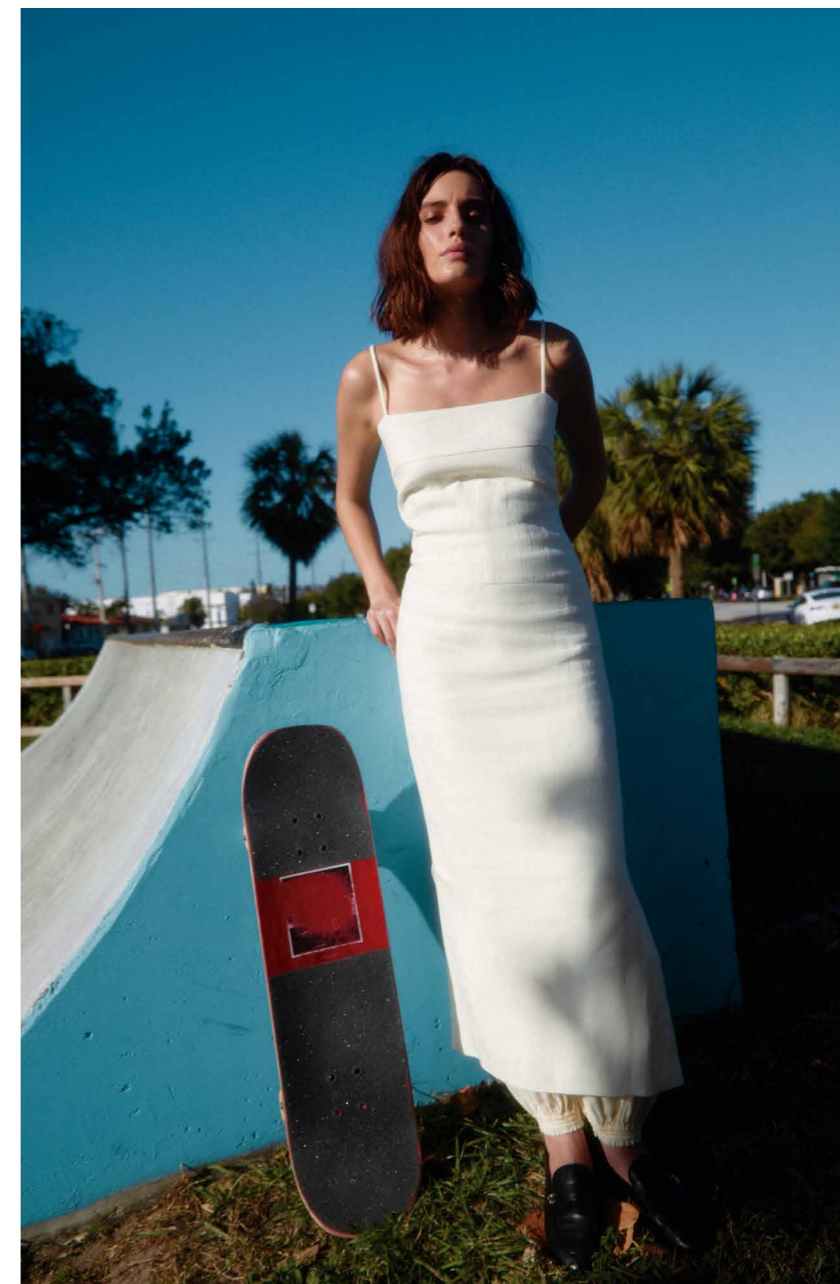
Vestido y bambuchas, TORY BURCH .