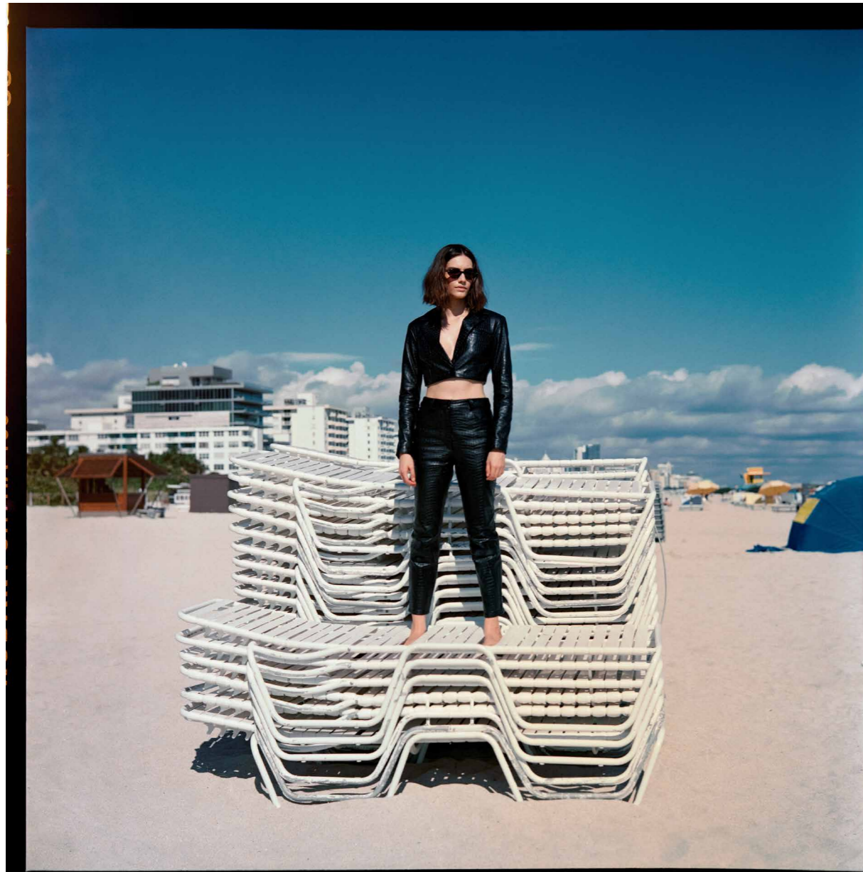
Pantalón y saco, ALIN JOTAR. Lentes, VOGUE EYEWEAR.

Maquillaje y pelo: GIANLUCA MANDELLI @CREATIVE.MANAGEMENT. Asistentes de foto: NICHOLAS SGAGLIONE Y GUIRI REYES. Producción: SYAMA REYES. Modelo: GABRIELLE @THESYNDICAL. Locación: @HILTONBENTLEY @SANTORINIBYGEORGIO.