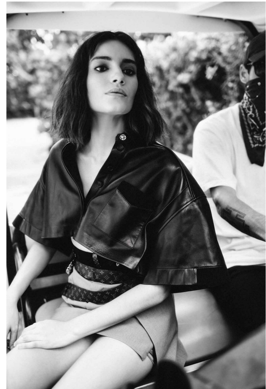
Falda y top, LOUIS VUITTON.