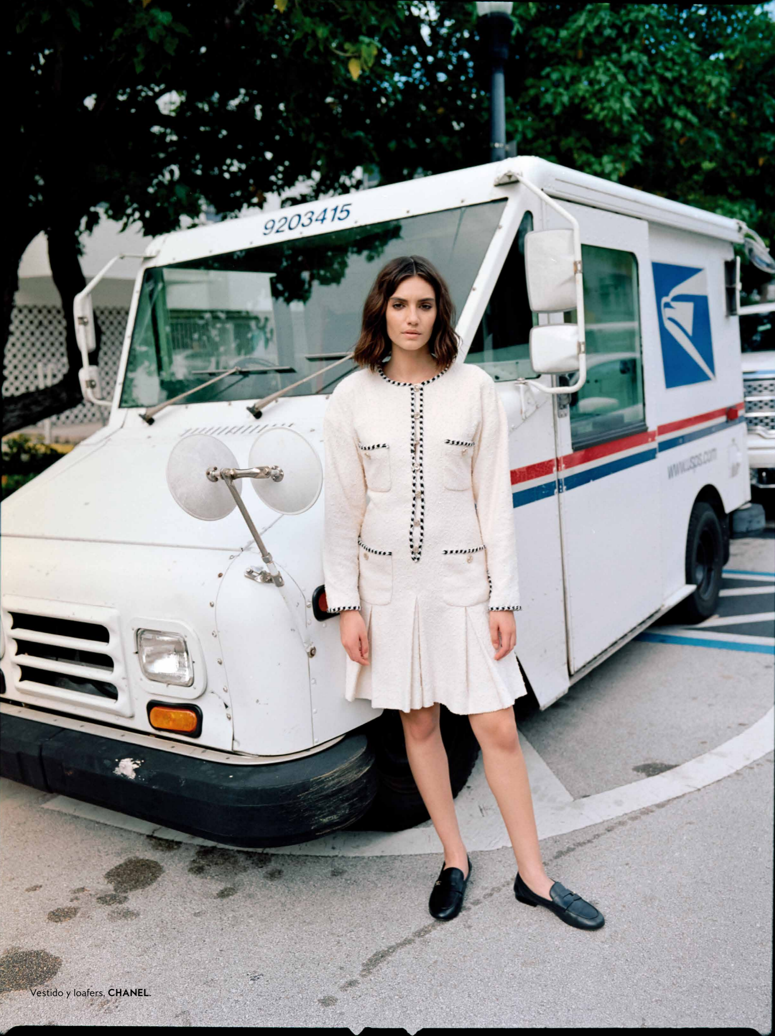
Vestido y loafers, CHANEL.