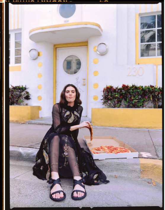
Vestido y sandalias, DIOR.