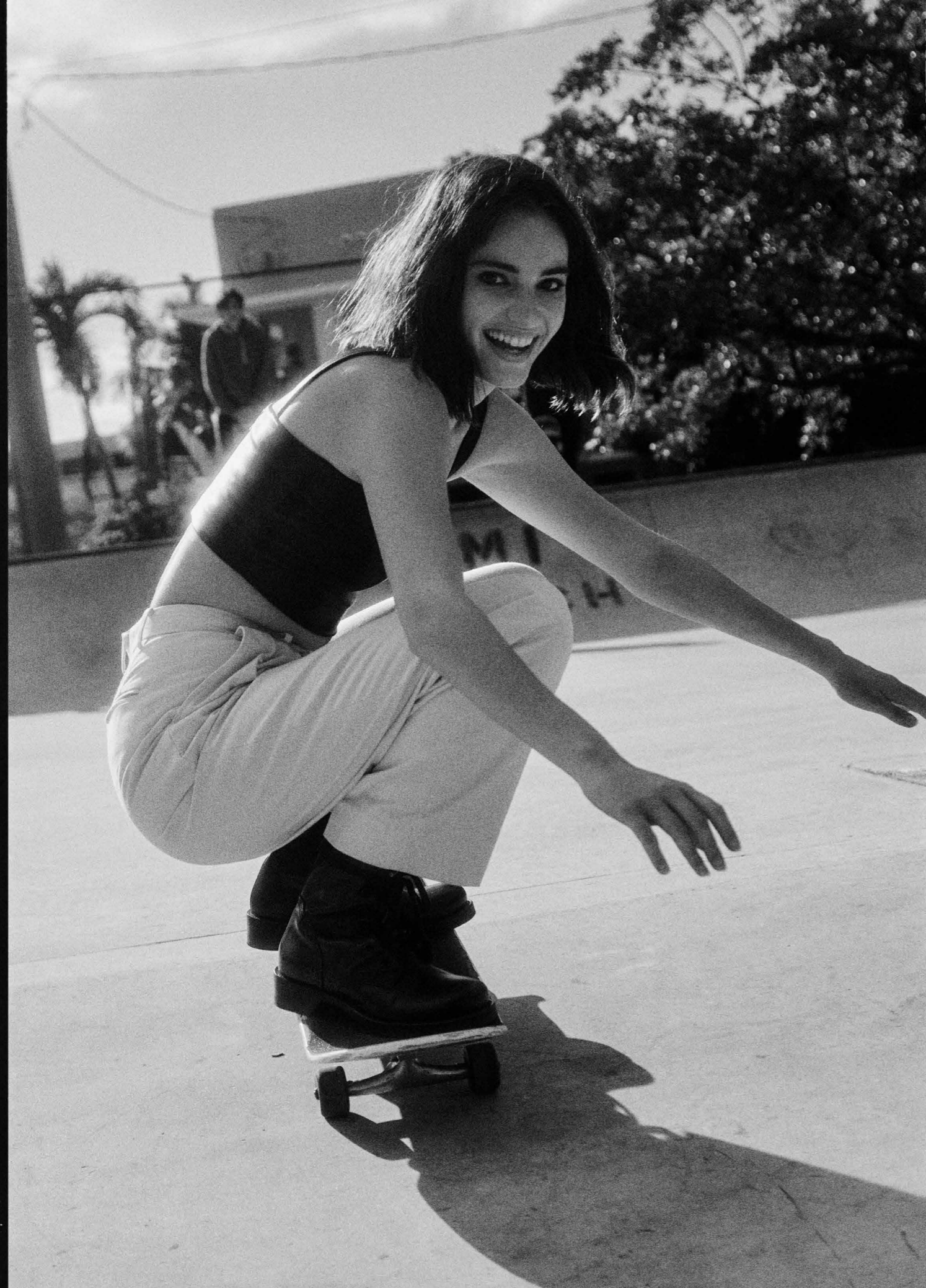
Pantalón, TORY BURCH . Top, ALIN JOTAR . Botas, LOUIS VUITTON .